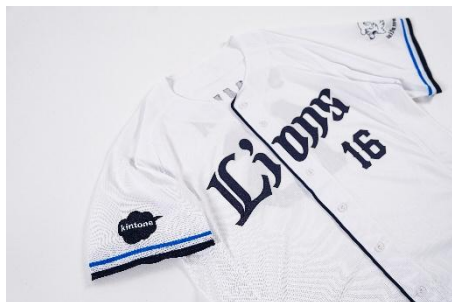
kintone のロゴが入ったユニフォーム